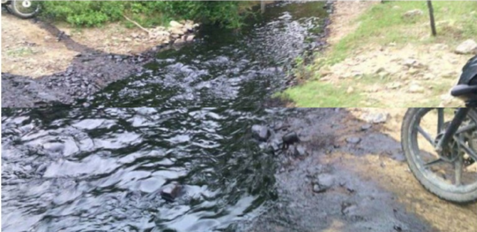
Acción contra el oleoducto Caño Limón Coveñas / Imagen de referencia

Autoridades trazan contingencia en la región del Catatumbo