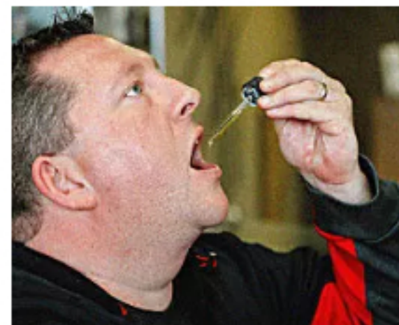
Médicos desconcertados: el nuevo aceite de CBD que arrasa en COLOMBIA