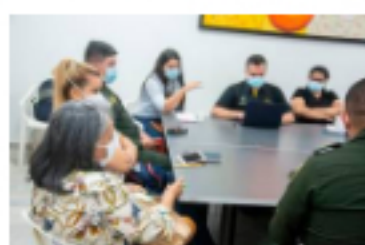
Crean red de apoyo con taxistas del Puerto