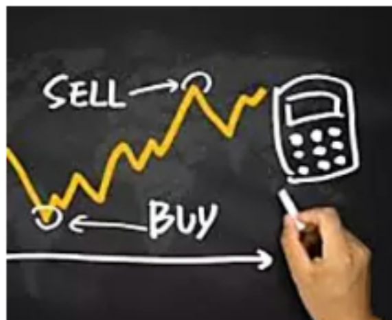
Compra o venta? Abra una cuenta ahora!