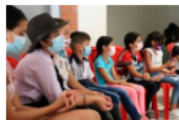
'Pequeños titanes' llegó con talleres a la comuna Siete