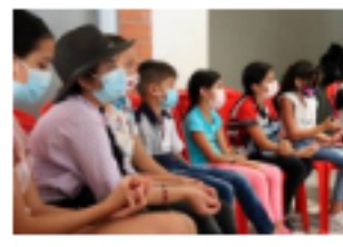
'Pequeños titanes' llegó con talleres a la comuna Siete

"A través de las empresas contratistas se logró una contratación de $230.000 millones con proveedores locales.