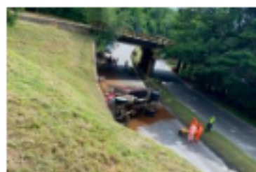
Un camión se volteó en la vía Barrancabermeja - Bucaramanga