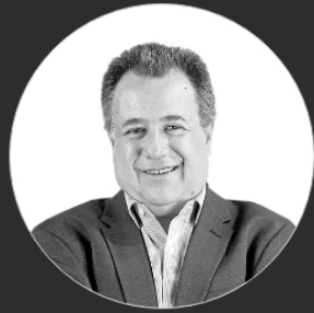
ANALISTAS | 27/08/2021