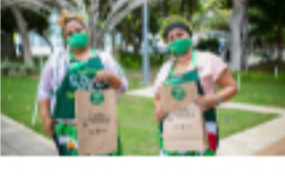
Vuelve el Festival del Pastel 🕒 26 de agosto de 2021