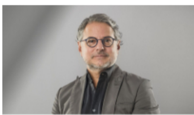
Solarisbank, participado por BBVA, capta 190 millones 🕒 26 de julio de 2021