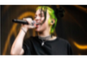
Todas las claves del nuevo cambio de look de Billie Eilish 🕒 26 de agosto de 2021