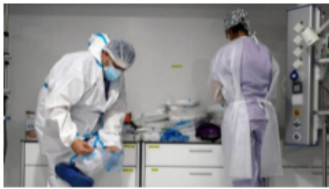
Agosto arranca con 3.193 nuevos casos de coronavirus en la Comunidad Valenciana 🕒 2 de agosto de 2021