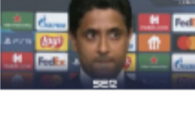
«No vamos a cambiar»: AI 🕒 26 de agosto de 2021