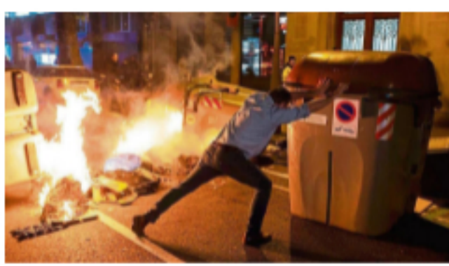
La Fiscalía pide procesar a los CDR detenidos por pertenencia a organización terrorista 🕒 20 de agosto de 2021