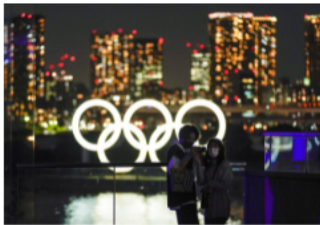
¿Qué pasa con los Juegos Olímpicos de Tokio? La comunidad científica critica las medidas previstas 🕒 27 de mayo de 2021