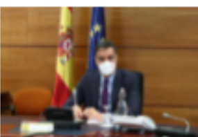
Los ‘últimos de Afganistán’: más de 70 españoles, pendientes del plan de Sánchez 🕒 26 de agosto de 2021