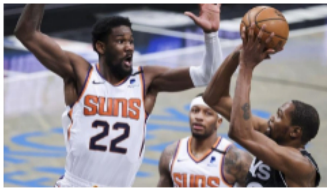
Kevin Durant encabeza el equipo de Estados Unidos para Tokio 2020 🕒 28 de junio de 2021