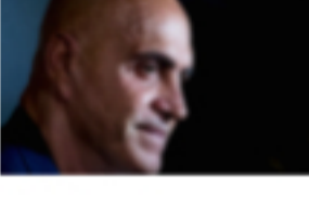
Kiko Matamoros siembra la duda sobre su futuro en Sálvame 🕒 26 de agosto de 2021