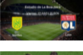
Previa del encuentro: FC Nantes 🕒 26 de agosto de 2021