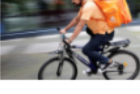
El ministro afgano que acabó de rider en Alemania 🕒 26 de agosto de 2021