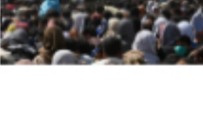
Trasladan a 759 afganos a los centros del sistema de acogida español de 14 comunidades autónómicas 🕒 26 de agosto de 2021