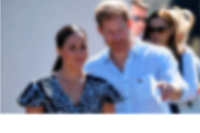
Harry y Meghan Markle: Las incendiarias revelaciones de la actualización de su biografía reabren la brecha con Windsor 🕒 26 de agosto de 2021