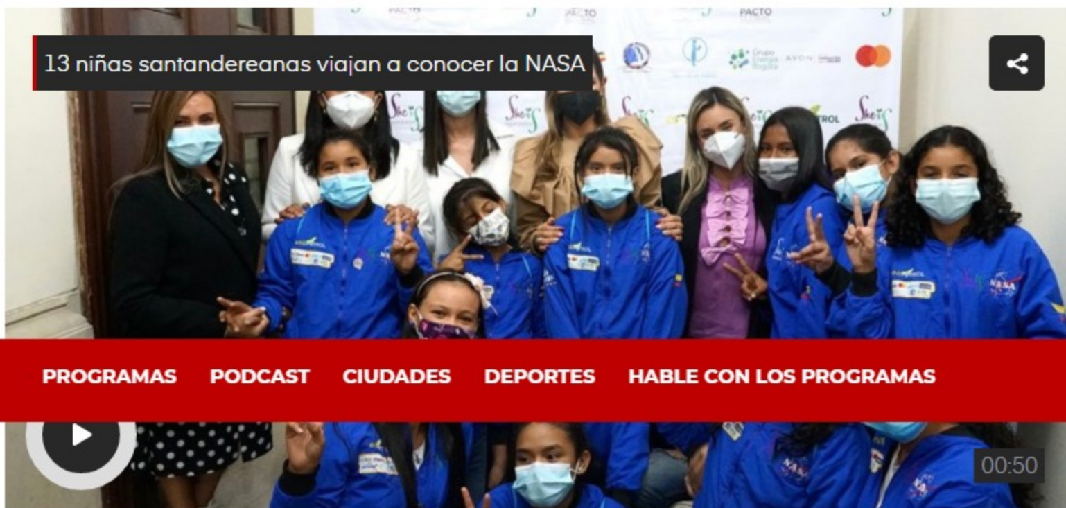
13 niñas santandereanas viajan a conocer la NASA

Las menores son de familias vulnerables de los municipios de Puerto Wilches y Barrancabermeja. También van dos de Cantagallo en el Sur de Bolívar.