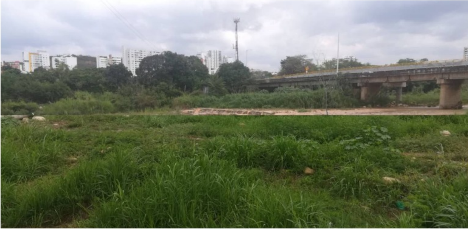
Río Pamplonita

La acción busca garantizar las condiciones de seguridad