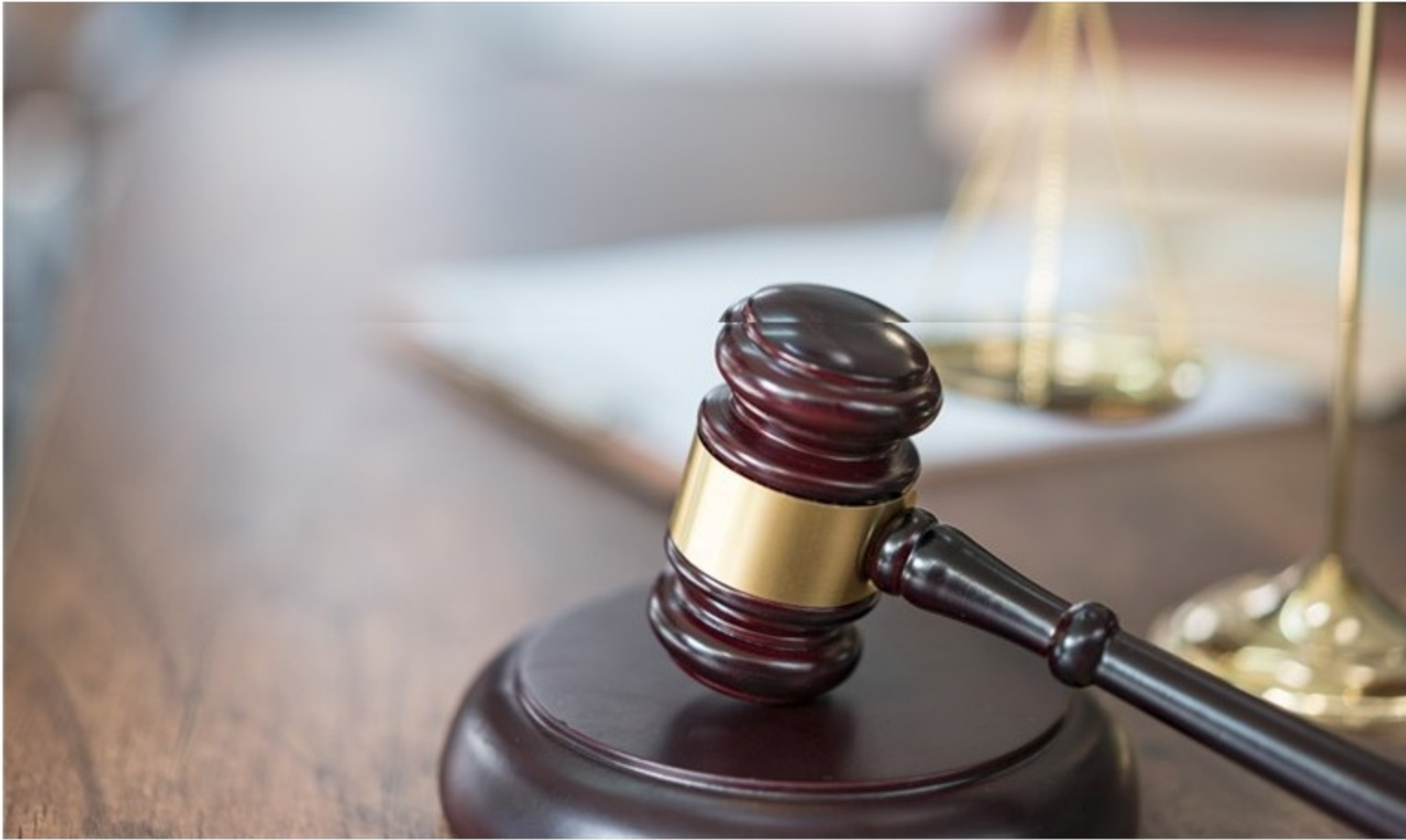
Tribunal ratifica admisión de acción popular contra venta de ISA.

Los tribunales aceptaron la acción popular que la Fundación Defensa de la Información Legal y Oportuna interpuso contra el negocio por ISA entre el Minhacienda y Ecopetrol .