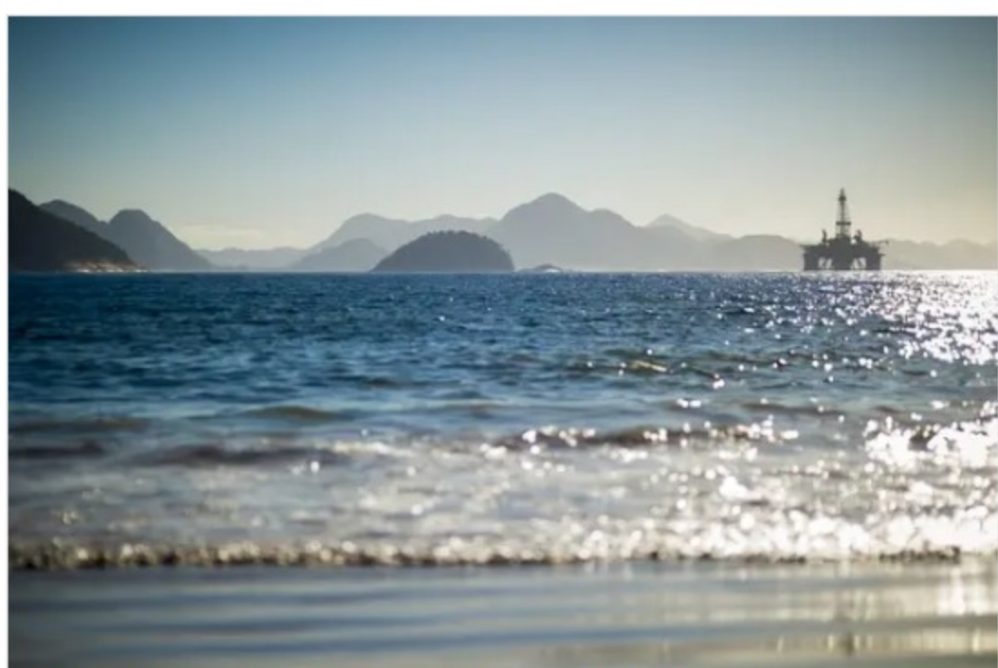
Una plataforma costa afuera en Brasil