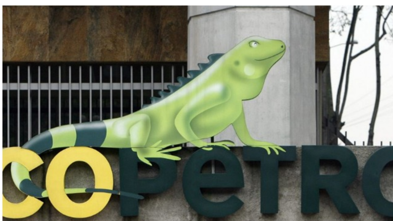
Ecopetrol compra el 51,4 % de la eléctrica ISA por 3.610 millones de dólares