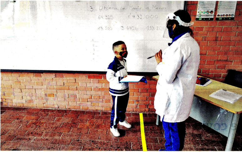
Colegio Bellavista, en la localidad de Kennedy.