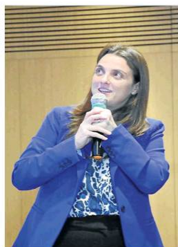
La ministra Karen Abudinen está en la lupa de la investigación por el anticipo del contrato.

BOGOTÁ La continuidad del contrato de $1,07 billones entre el Ministerio de Tecnologías de la Información y las Comunicaciones y la Unión Temporal Centros Poblados sigue en el aire.