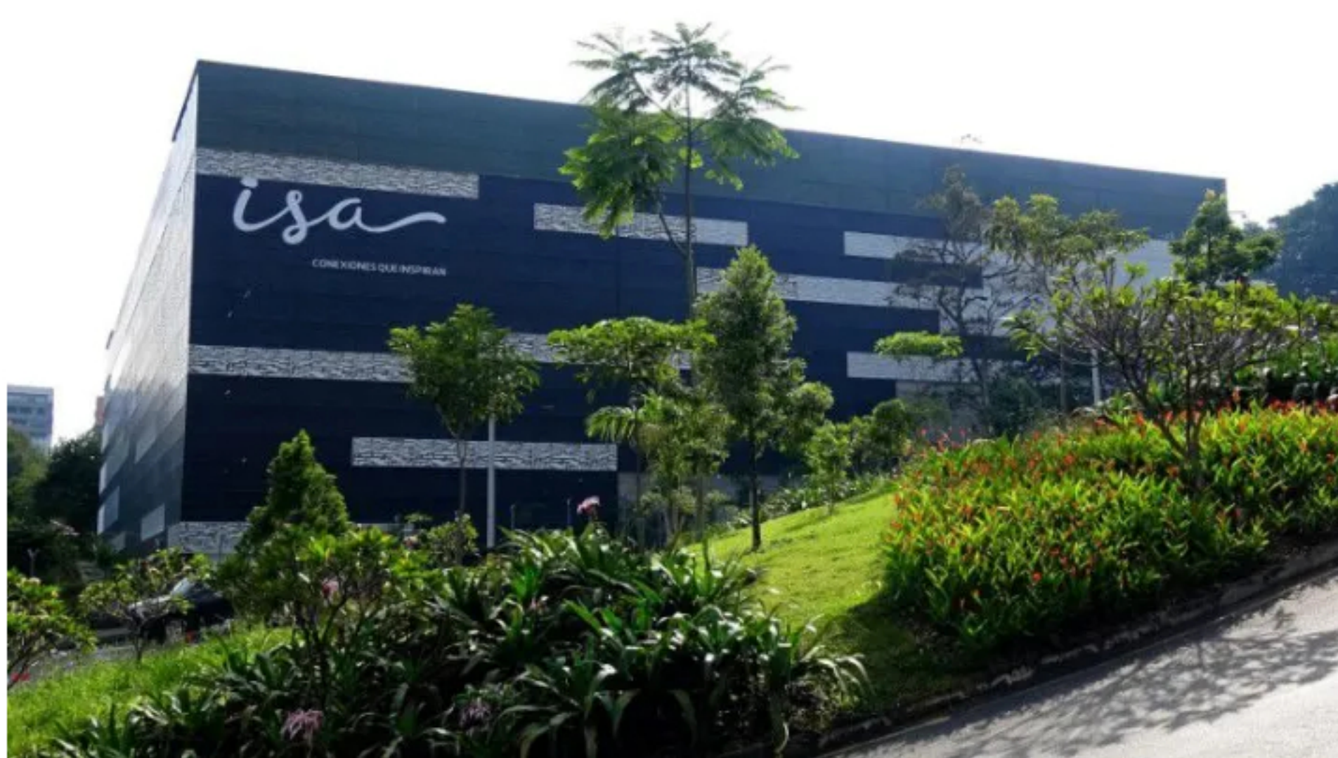
Foto de archivo. Panorámica de la sede de ISA en la ciudad de Medellín, Colombia, 27 de junio, 2019. REUTERS/Luis Jaime Acosta (LUIS JAIME ACOSTA/)

Posted By: El Portal de Salta / 0 Comment / argentina