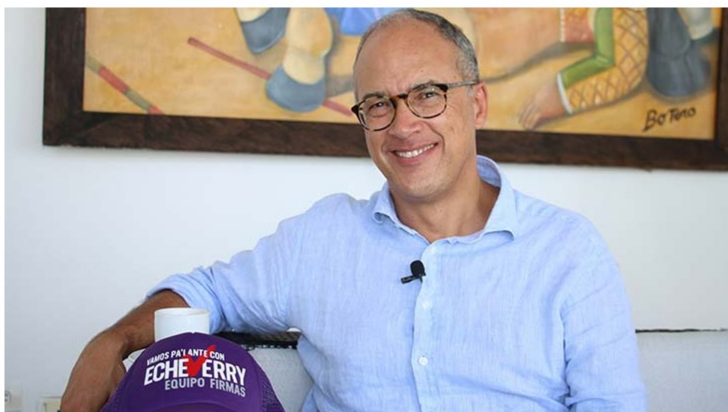
Juan Carlos Echeverry Garzón, precandidato presidencial y exministro de Hacienda.

El precandidato presidencial, Juan Carlos Echeverry Garzón, habló sobre actualidad de Colombia y el departamento.