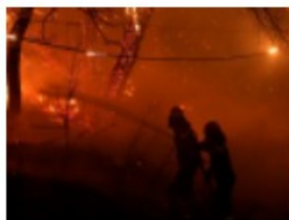
Miles de refugiados en