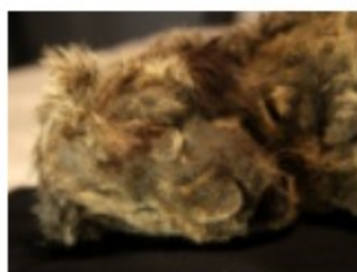
‘Sparta’ el ‘Simba’ prehistórico que vivió en Siberia hace 28.000 años