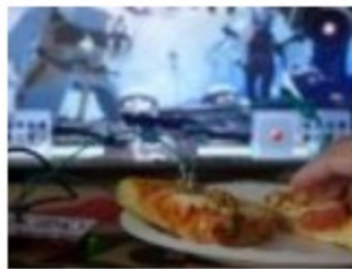
Llega al final del juego ‘Dark Souls’ con un mando hecho de pizza