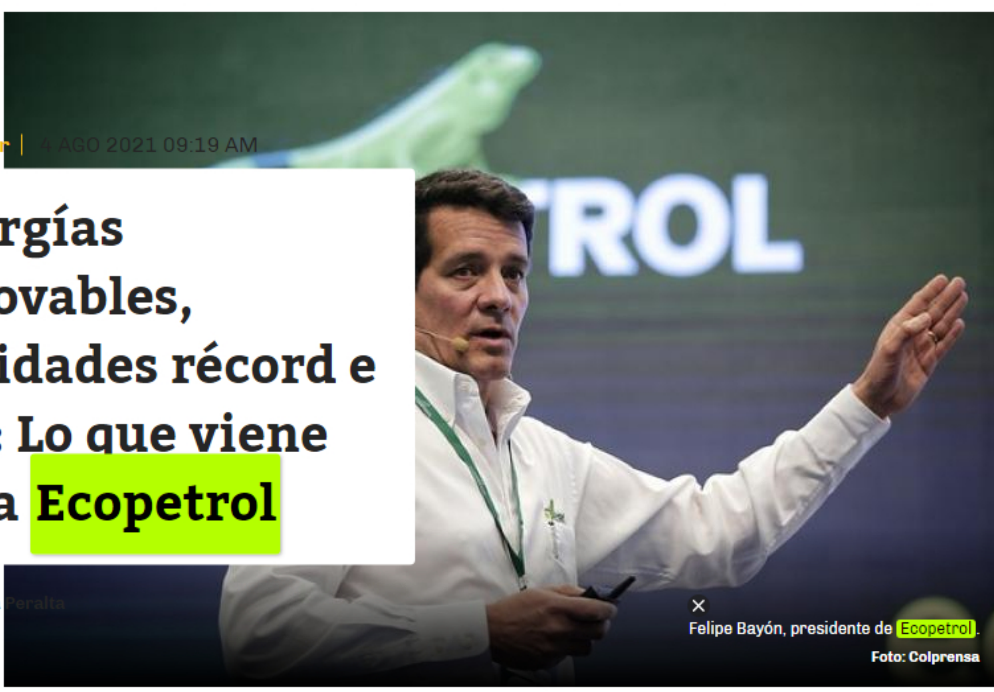
Felipe Bayón, presidente de Ecopetrol.