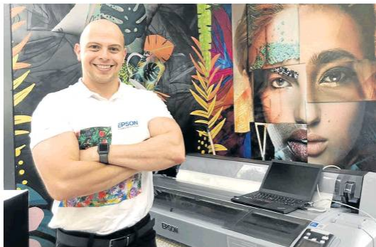
Sofía Solórzano / LR

La marca Epson , liderada en el país por Heisson Nessi , presentó en Colombiatex+Colombiamoda 2021 las novedades de su portafolio de sublimación textil. Se trata de las impresoras de sublimación con tintas fluorescentes SureColor F571 , un equipo para personalizar objetos y telas. Estas impresoras de alto rendimiento ofrecen calidad profesional y utilizan la tecnología PrecisionCore . (JL)