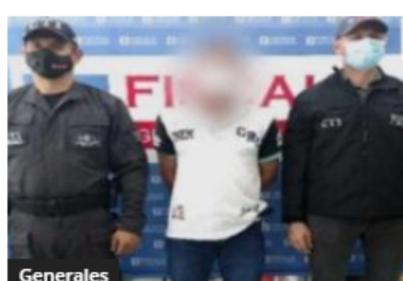
A la cárcel hombre que abusó de su hija de 10 años y la embarazó, en Tolima