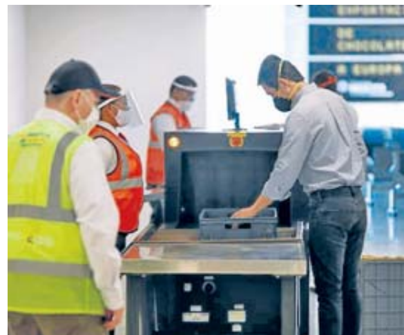
Entre enero y marzo de 2021, por el aeropuerto Palonegro se han movilizado 212.129 pasajeros.

"Este balance demuestra que el transporte aéreo se ha