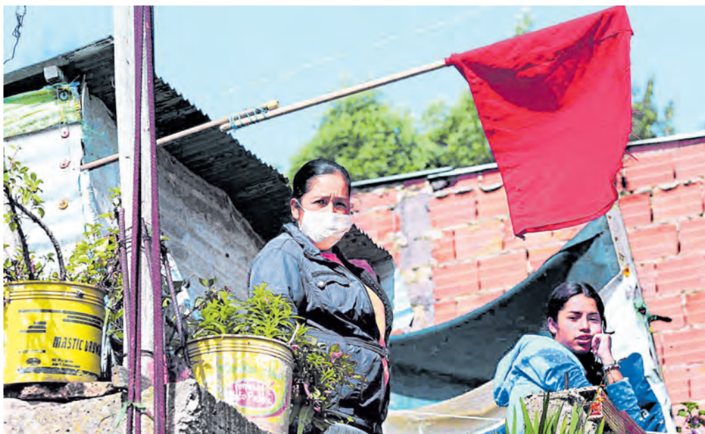
Según el Dane, las zonas urbanas aportaron la mayor parte del deterioro de las condiciones de vida.

Bogotá aportó 1,1 millones de pobres más. Las ayudas del Gobierno mitigaron el aumento en 3,6 pp. Pág. 8