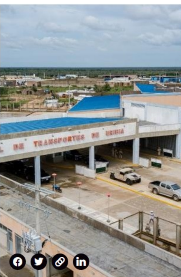
Aeropuerto en Uribia, La Guajira.