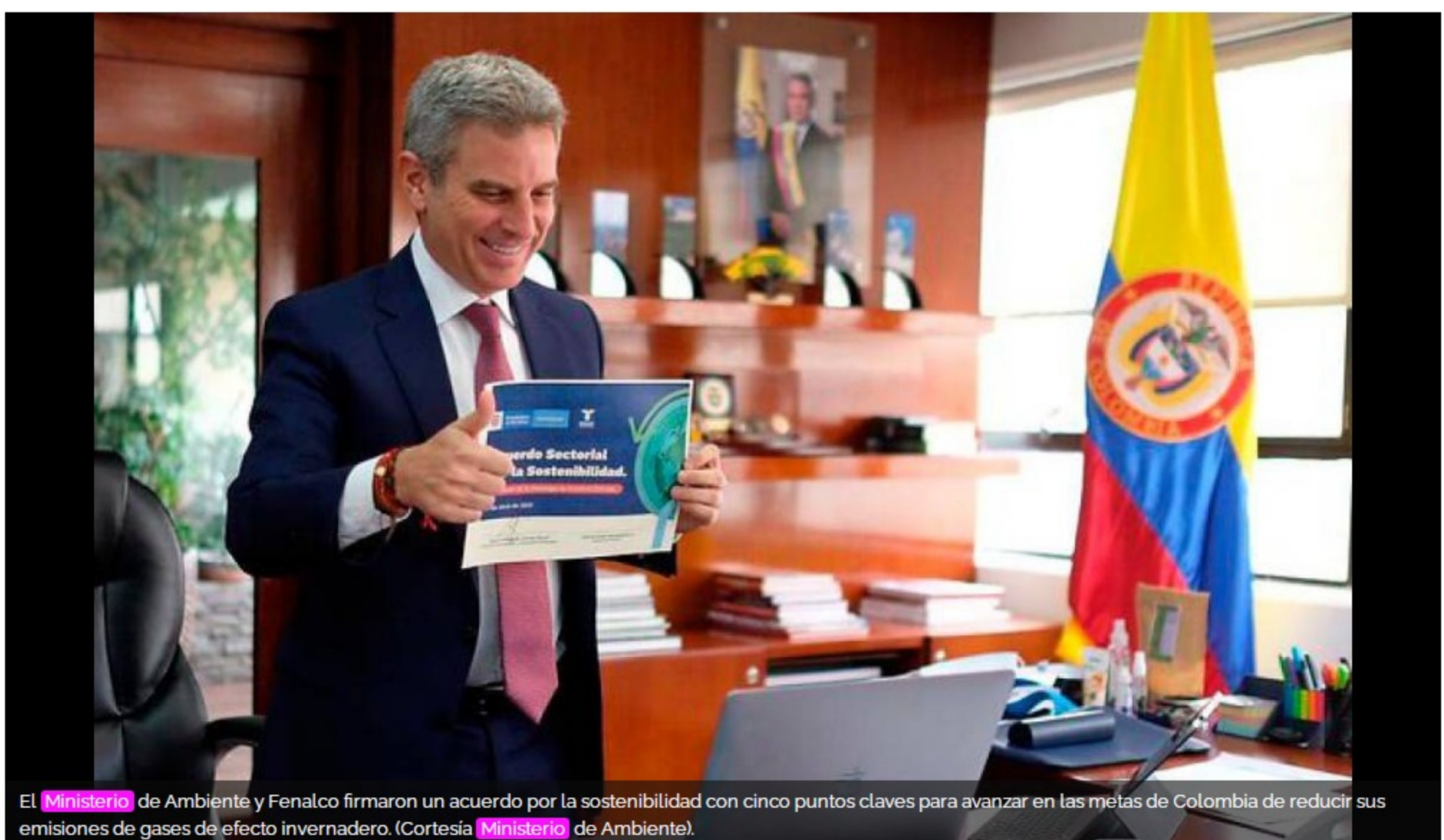
El Ministerio de Ambiente y Fenalco firmaron un acuerdo por la sostenibilidad con cinco puntos claves para avanzar en las metas de Colombia de reducir sus emisiones de gases de efecto invernadero. (Cortesía Ministerio de Ambiente).

El convenio hace parte de los esfuerzos del Ministerio para consolidar agendas estratégicas y acuerdos con diferentes sectores para que ayuden a preservar el medio ambiente.