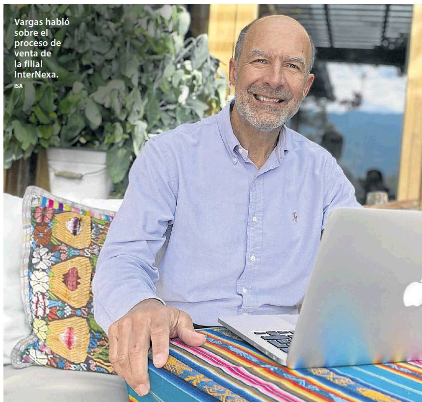
Vargas habló sobre el proceso de venta de la filial InterNexa . ISA

Eso es algo que el grupo no hace normalmente, vender activos. A lo largo de la historia hemos sido un grupo comprador. Pero como compañía, tenemos la responsabilidad de gestionar nuestro portafolio y saber que a veces ese proceso de compra debe traer ventas. Esta decisión creemos que genera el mejor balance entre riesgos y beneficios, porque nos permite manejar nuestro portafolio y dirigir el dinero de esta venta a negocios más rentables.