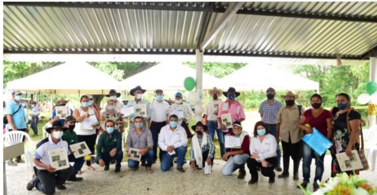
un proyecto denominado 'Implementación de unidades productivas agropecuarias de cultivos y especies menores en la vereda Isla Turbayista'.

EN PUERTO GAITÁN POLICÍA HALLÓ VARIAS SUSTANCIAS ALUCINÓGENAS LISTAS PARA COMERCIALIZAR