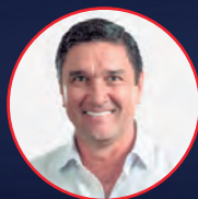
Juan Carlos Cárdenas Alcalde de Bucaramanga