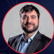
Jaime Pumarejo Alcalde de Barranquilla