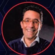
Ignacio Gaitán Presidente de Innpulsa Colombia