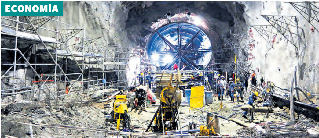
EPM y la Alcaldía de Medellín afirman que megaproyecto seguirá con desarrollo de obras.