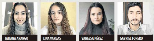
Pierre Ancines / LR

Periodistas de LR que participaron en el Inside LR