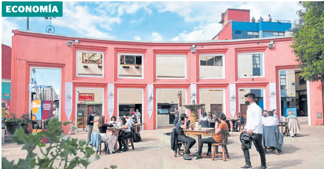
La recuperación avanza con la apertura de restaurantes a cielo abierto, como en el sector de La Candelaria.