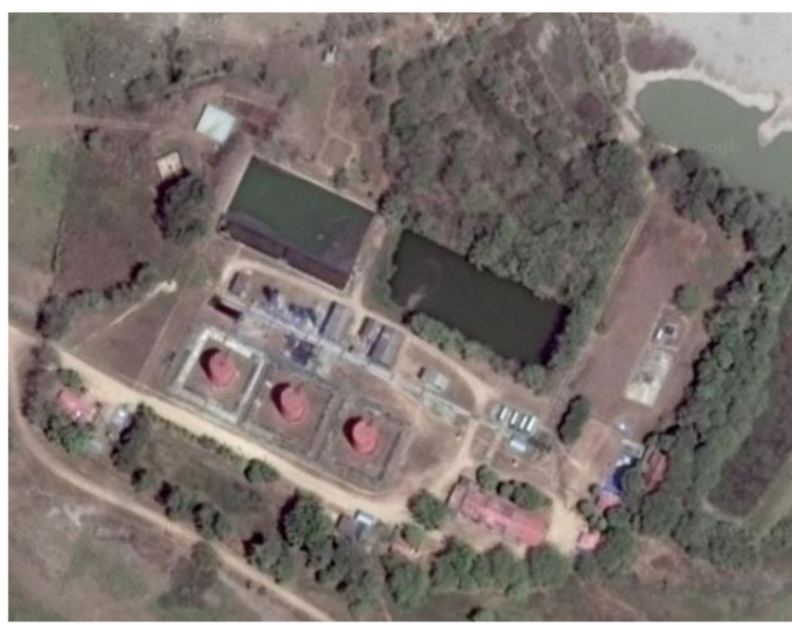
IMAGEN CAÑO GARZAS EN CASANARE

Del total de la mano de obra no calificada (916), el 99,8% corresponde a personas del sitio donde se desarrollan los proyectos y operaciones, y de la mano de obra calificada (1.174) el 76% también es local.