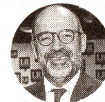
Camilo Sánchez Presidente de Andesco

MILLONES DESTINÓ EL GOBIERNO NACIONAL ESTE AÑO PARA ELECTRICARIBE, TRAS FIRMAR UN CONPES.