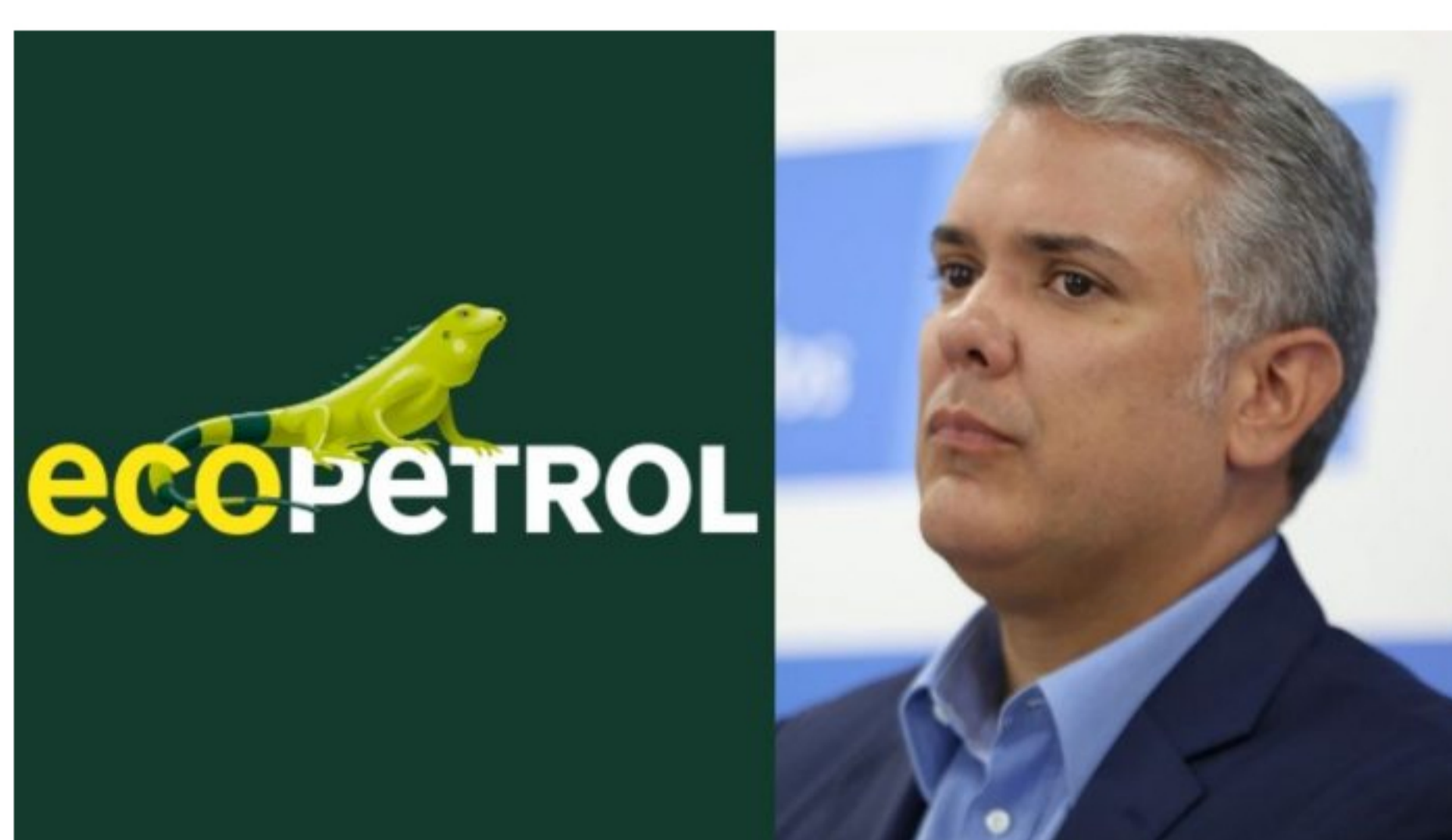
Caída del Decreto 811 de 2020, a su vez, complica más el préstamo a Avianca Holdings S.A.

En la noche de ayer, se celebró que la Corte Constitucional hundiera el Decreto 811 de 2020, que validaba la venta de activos, entre ellos, empresas del Estado.