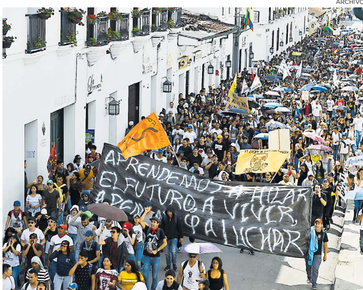
Movilización en Bogotá del pasado paro nacional del 21 de noviembre de 2019.