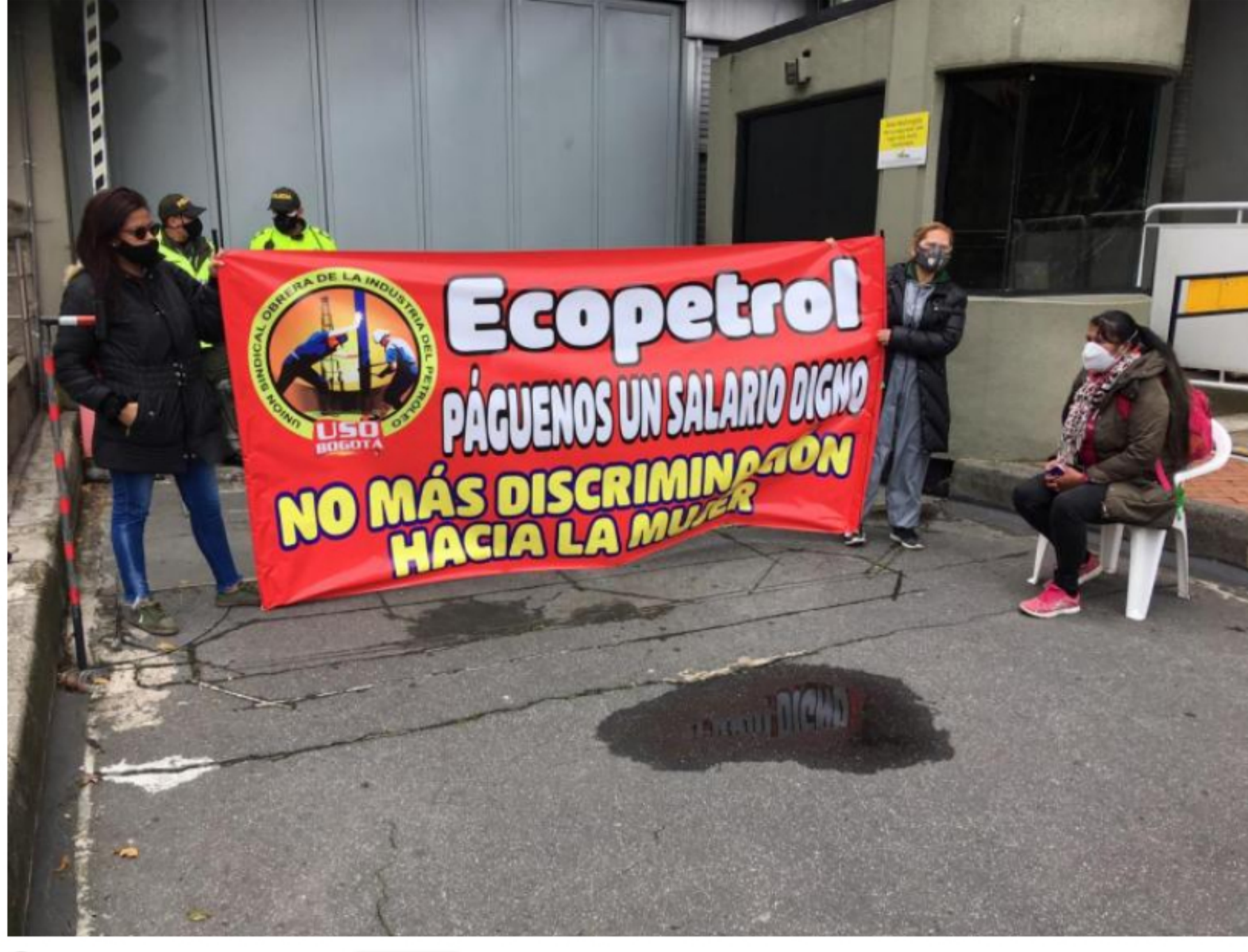
Señoras del aseo y los tintos de Ecopetrol ganan menos de un salario mínimo.

Con 89 humildes mujeres, la mayoría cabezas de hogar, que limpian las excretas, lavan los pisos, asean los escritorios, preparan y llevan el tinto a los ejecutivos de la más grande empresa del Estado y la más productivas, Ecopetrol, a quienes les rebajaron el salario a la mitad con el argumento de la pandemia.