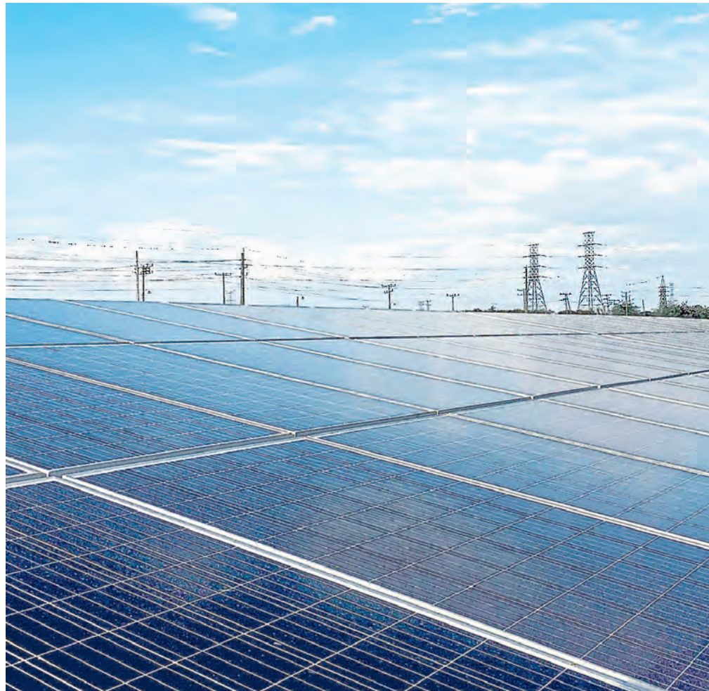
En el país hay 226 proyectos en marcha para el montaje de plantas solares en distintas regiones. CEET

Estas iniciativas se ejecutan en 25 departamentos. Valle del Cauca registra el mayor número de obras. Son pequeñas centrales hidroeléctricas, así como plantas solares, eólicas y de biomasa inscritas en el Registro de Proyectos de la Upme. Pág. 6