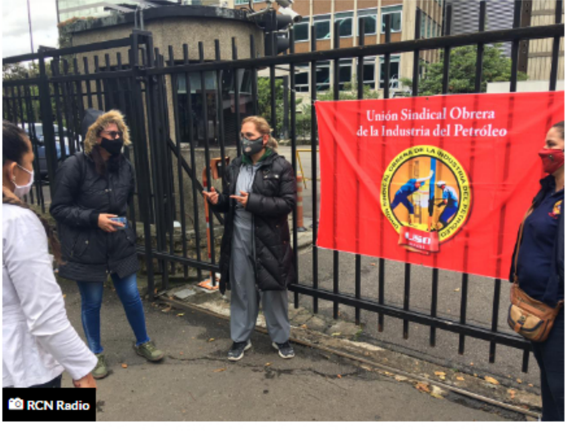
Señoras del aseo y los tinto de Ecopetrol ganan menos de un salario mínimo.