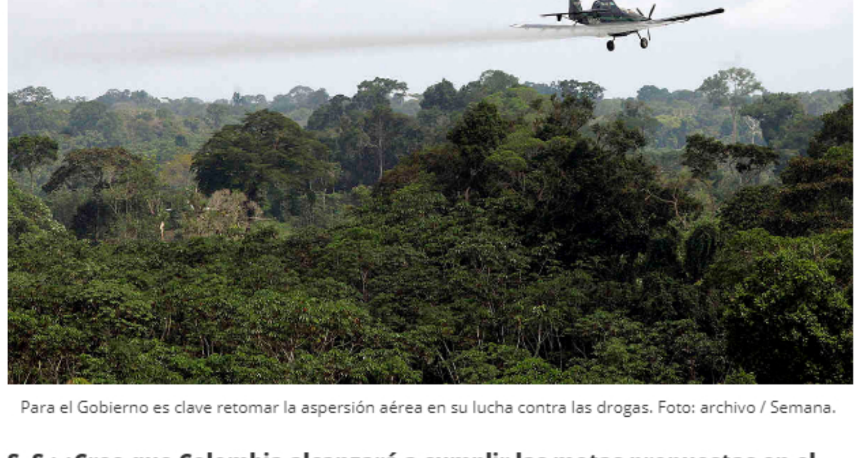
Para el Gobierno es clave retomar la aspersión aérea en su lucha contra las drogas.

El fracking es una distracción. Deberíamos estar pensando cómo transformamos a Ecopetrol , discutiendo qué papel va a jugar esta empresa en el futuro. El petróleo no es el futuro. El debate sobre el piloto del fracking es corto de visión, incluso puede ser visto como una forma de evasión a las preguntas de fondo sobre el futuro.