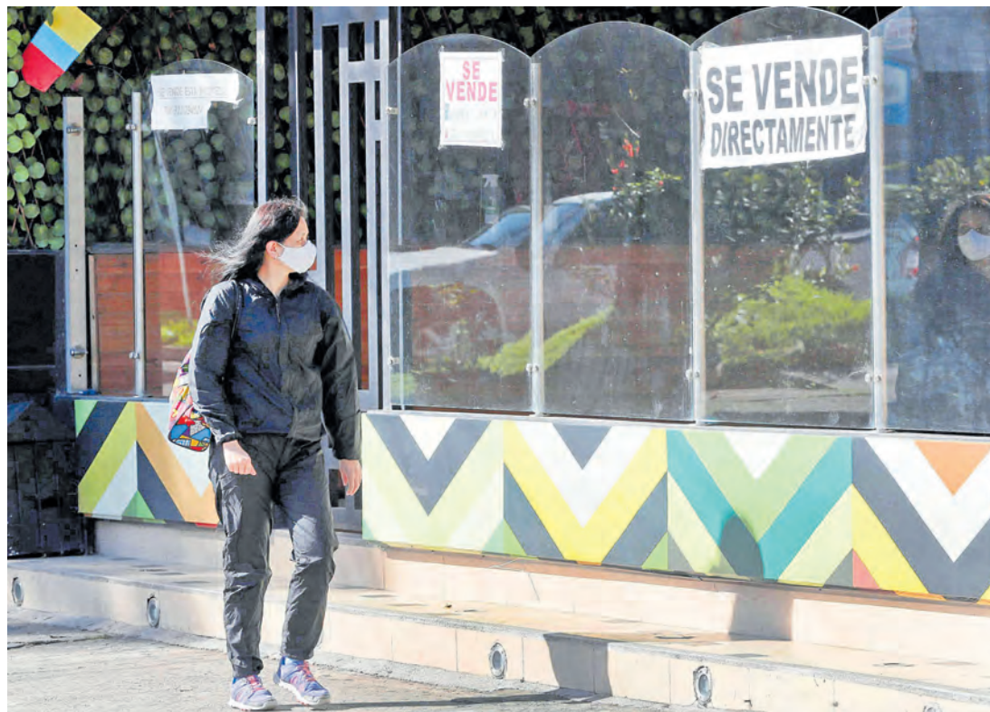
Se propuso que el subsidio al consumo funcione igual que las ayudas al interés de la vivienda. CEET

Portafolio conoció en exclusiva el abanico de propuestas que gremios y empresarios llevaron a la Comisión de Salvamento. Estas se dividen en ayudas a firmas y la demanda, y protección al sistema financiero. Compra de cartera, estímulo a cobertura del IVA, extender el Paef e impulsar la financiación digital, en el listado. Pág. 6