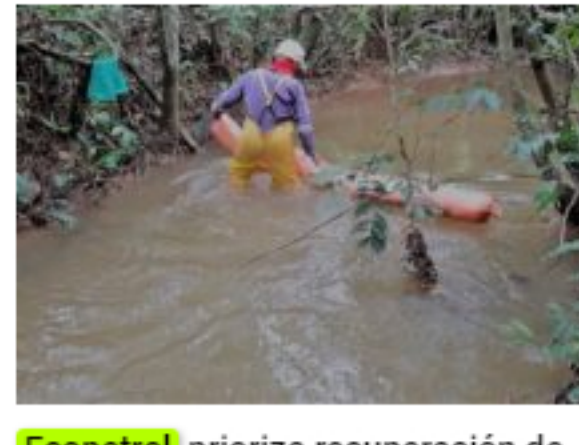
Ecopetrol prioriza recuperación de fauna y flora en vereda Montebello, Acacias