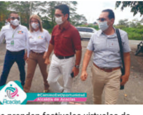
Se prenden festivales virtuales de octubre en Acacias