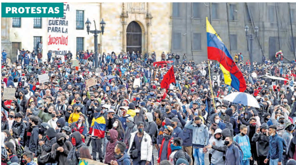
Con contadas excepciones, las manifestaciones de ayer en varias ciudades fueron pacíficas.

Este grupo de productos sumaría US$3.003 millones en 2020. Carne y pinya logran aval para entrar a Egipto y Canadá, respectivamente. Pág. 7