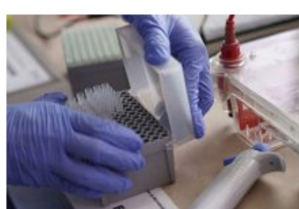
27 Nuevos casos de covid-19 en el departamento de Arauca.