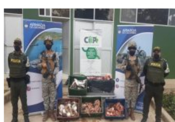
Armada de Colombia incauta más de media tonelada de carne de contrabando en Arauca.