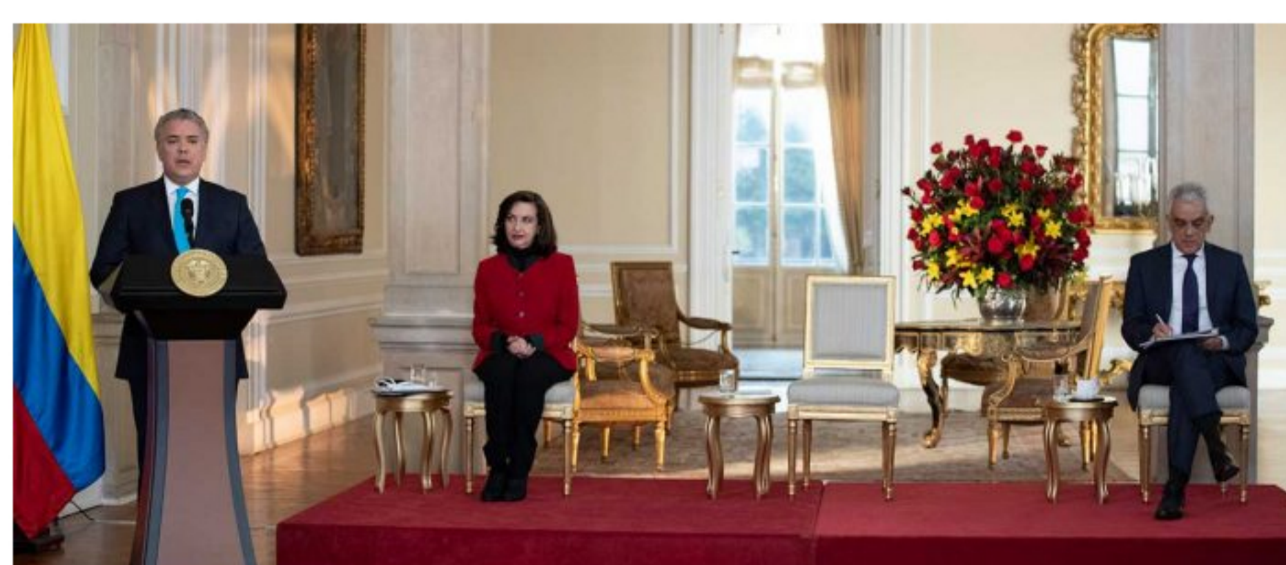
Colombia quiere liderar transición energética en América Latina y el Caribe: Presidente Duque

Para agosto del 2022, el país contará con más de 2.200 megavatios de capacidad instalada en esas energías renovables no convencionales, señaló en el Diálogo de Liderazgo del Fondo Verde para el Clima.