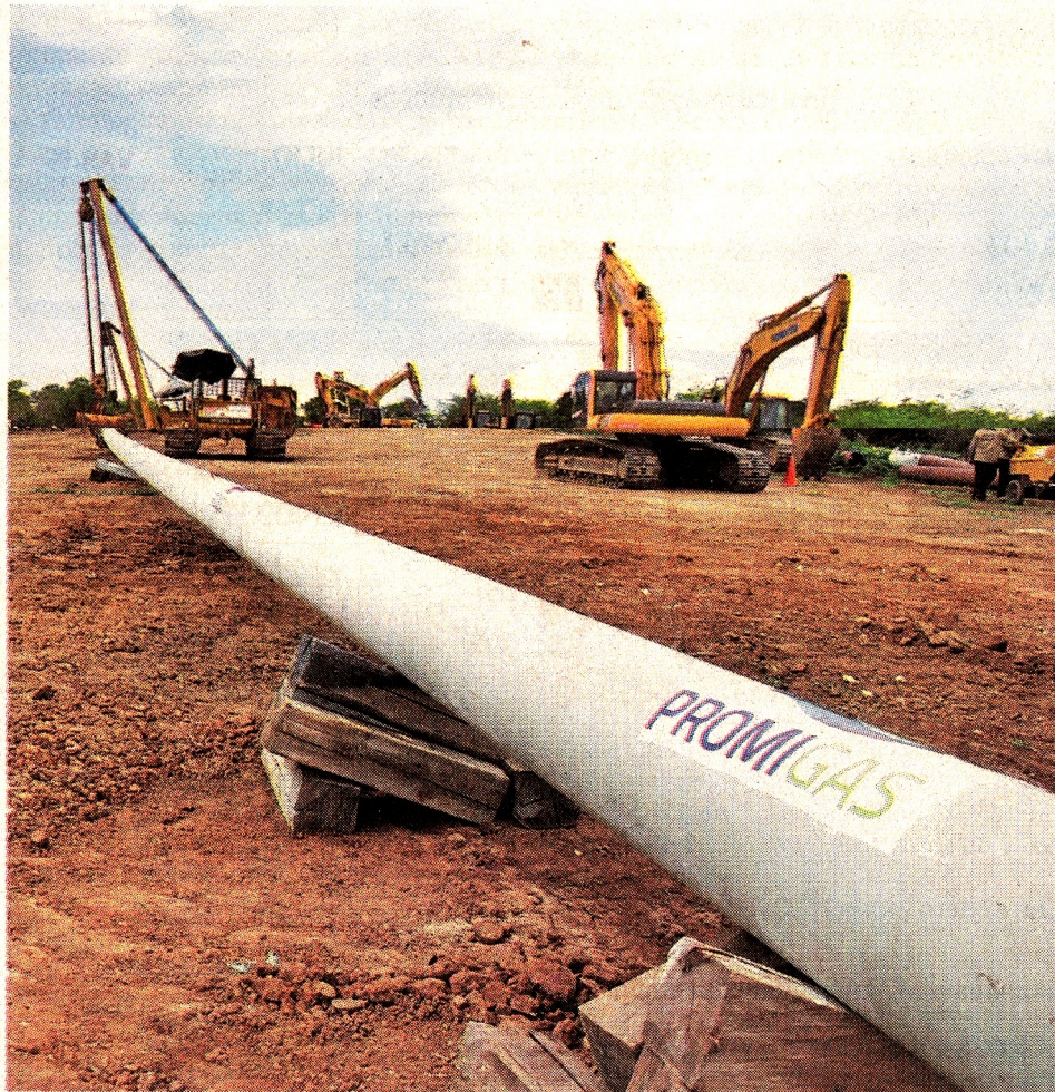
Los gasoductos tendrían una inversión de US$ 400 millones cada uno.

Canacol, no se quedó de brazos cruzados, y horas después del anuncio de Promigas a los medios, le comu-