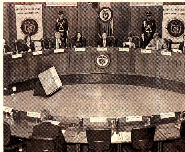
La Sala Plena declaró inconstitucional la norma. El Tiempo

LA SALA PLENA de la Corte Constitucional tumbó el Decreto 797 de 2020, emitido por el Ministerio de Comercio, Industria y Turismo durante el Estado de emergencia por la pandemia del covid, y que permitía la terminación unilateral de los contratos de arrendamiento comerciales.