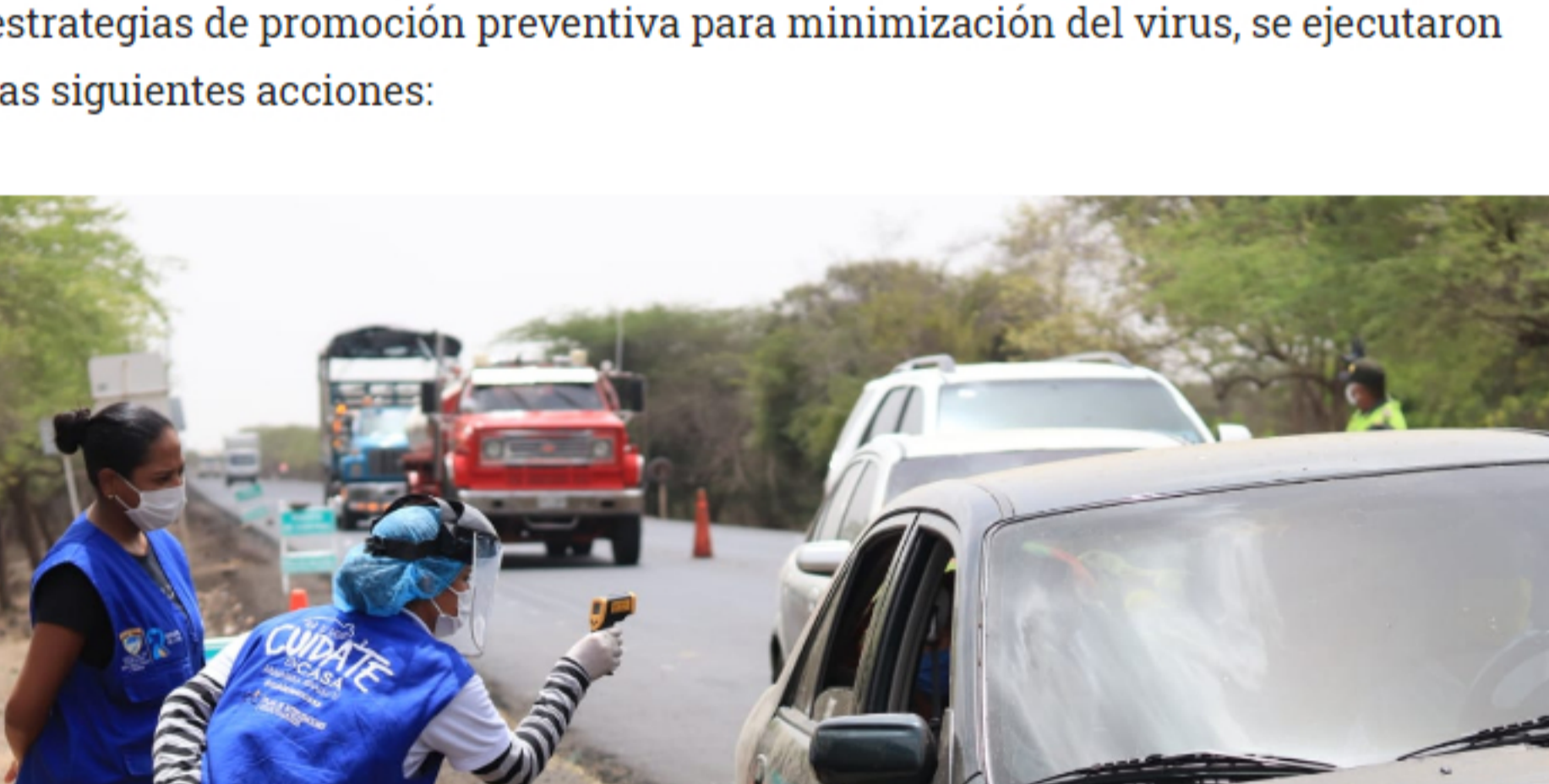
El PIC ejecutado por la Ipsi Aimmajaa ha tenido muy buenos comentarios dentro de las comunidades que han notado la presencia del Plan de Intervenciones Colectivas.

Desde la cartera de salud este año, se ha realizado un trabajo exhaustivo, debido a la complejidad de la pandemia por covid-19. Siguiendo los lineamientos de Instituto Nacional de Salud y la Organización Mundial de la Salud y aplicando estrategias de promoción preventiva para minimización del virus, se ejecutaron las siguientes acciones: