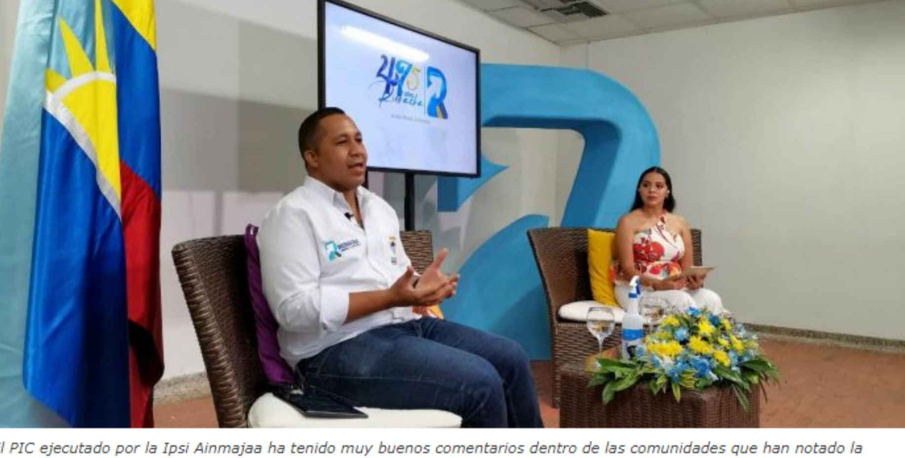
El PIC ejecutado por la Ipsi Aimmajaa ha tenido muy buenos comentarios dentro de las comunidades que han notado la presencia del Plan de Intervenciones Colectivas.

En el marco de los 475 años de poblamiento de Riohacha, la administración distrital dio a conocer los principales avances de cada dependencia alcanzados durante lo que va del año 2020.