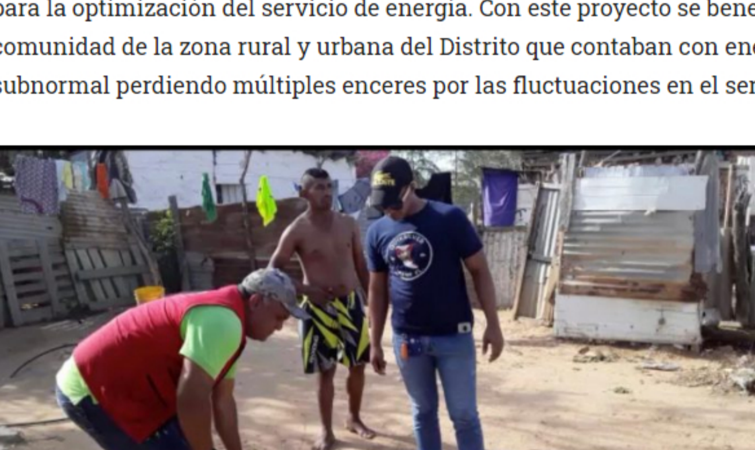
Muy diligente se le ha visto al secretario de Infraestructura, Keider Freyle Sarmiento.

Infraestructura y Servicios Públicos se realizó la construcción de redes eléctricas para la optimización del servicio de energía. Con este proyecto se benefició a la comunidad de la zona rural y urbana del Distrito que contaban con energía subnormal perdiendo múltiples enceres por las fluctuaciones en el servicio.