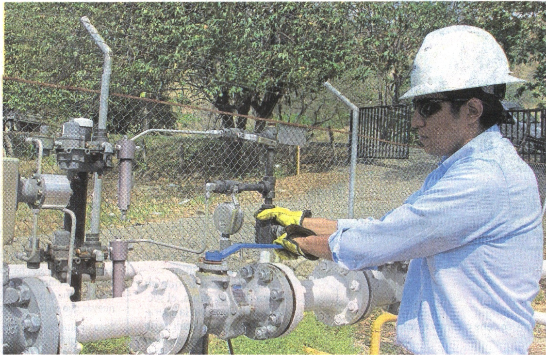
El sector está próximo a desarrollar grandes obras de transporte como el gasoducto Jobo - Transmetano.