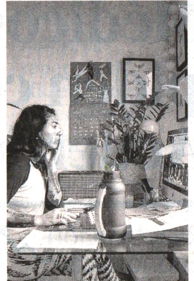
El 61% de las mujeres dicen que las jornadas crecieron más de 8 horas.

EMPLEOS se espera que generen los 123 proyectos en exploración, producción y transporte de gas natural para la seguridad energética de Colombia, en diferentes regiones. Se estiman que las reservas del combustible dan para más allá de 10 años.