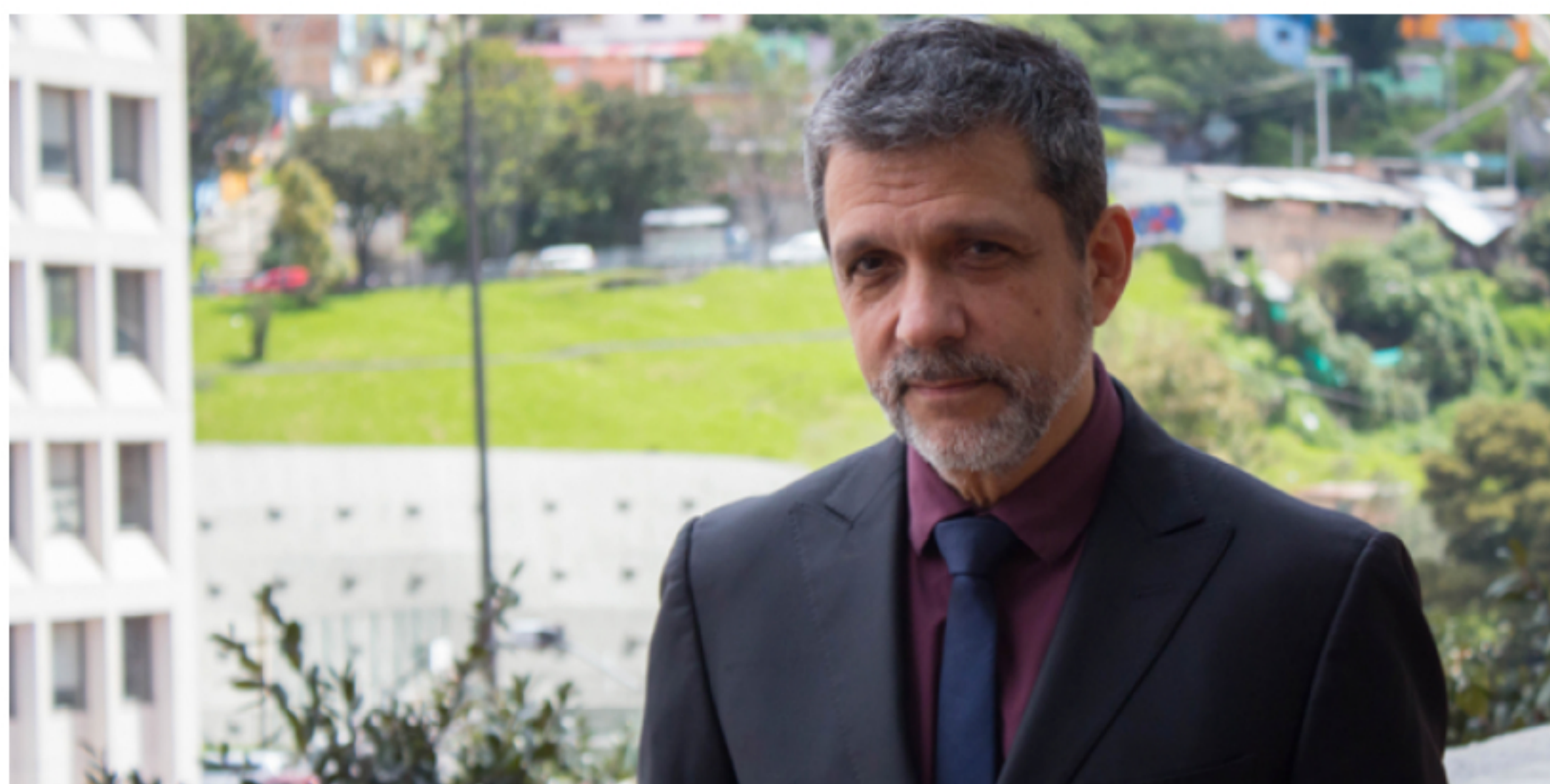
Orlando Ayala, exvicepresidente de Microsoft