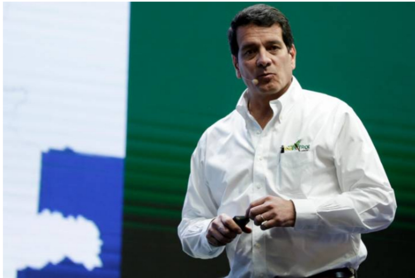
Ecopetrol ha retirado cerca de 900 válvulas ilícitas en sus ductos de transporte

Ecopetrol dio a conocer que entre enero y agosto se han retirado 895 válvulas ilícitas en los ductos de transporte de hidrocarburos en todo el país.