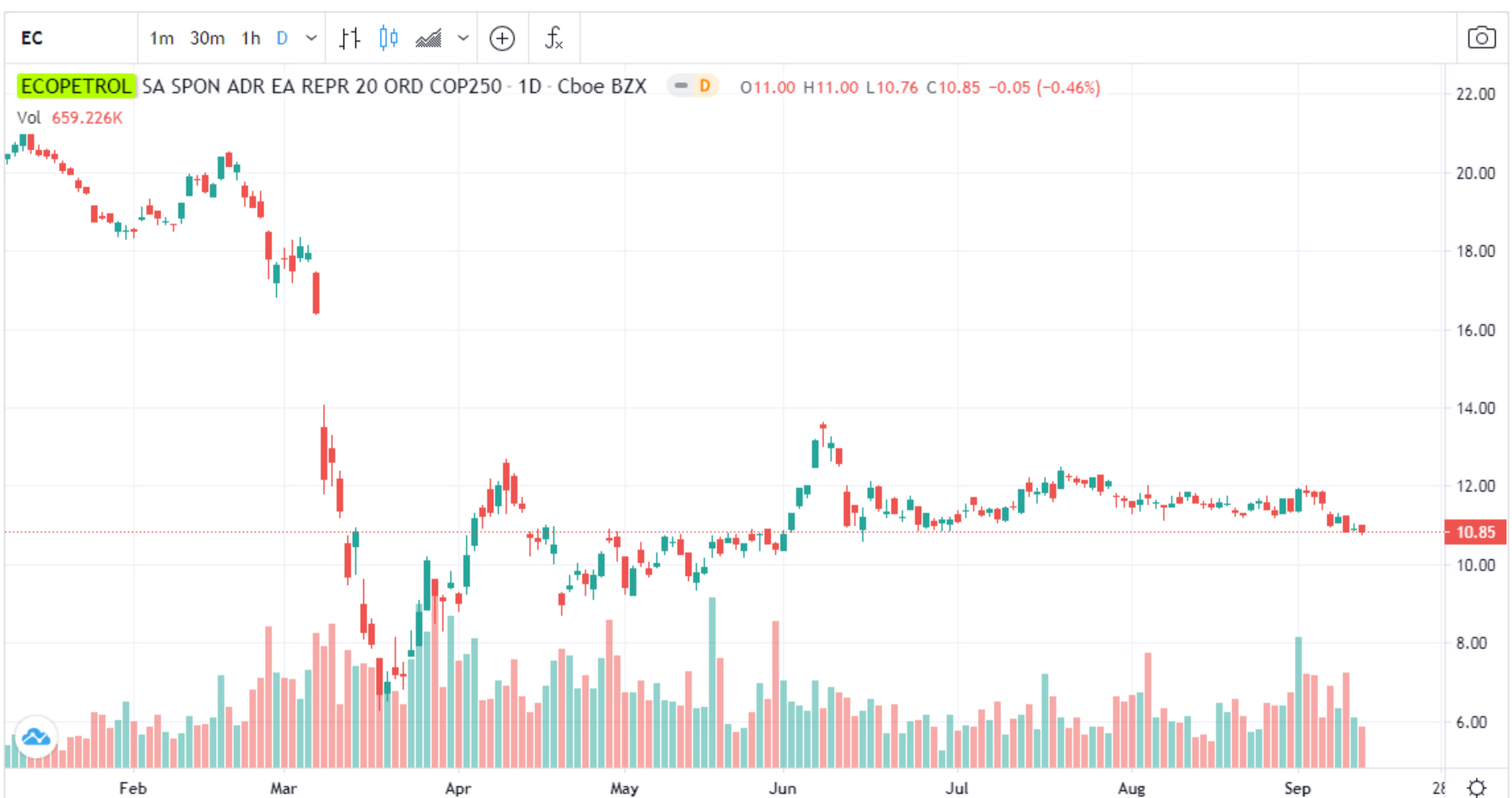
Gráfico EC por TradingView

<Publicación más reciente Publicación anterior>