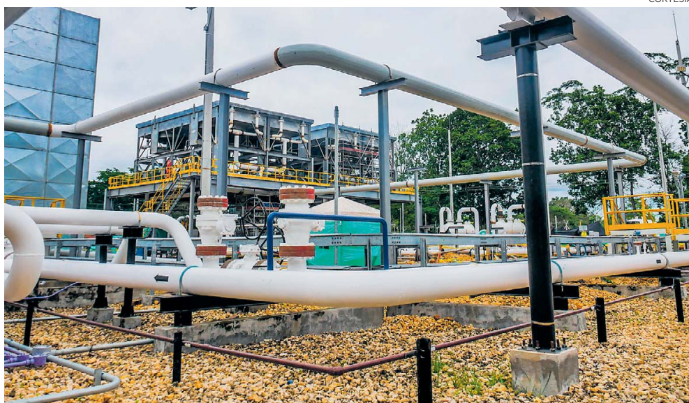
Instalaciones de la estación compresora de gas Filadelfia, ubicada en la Costa Caribe.

“Es necesario seguir trabajando en la actividad exploratoria, como en el caso del Atlántico, que se han he-