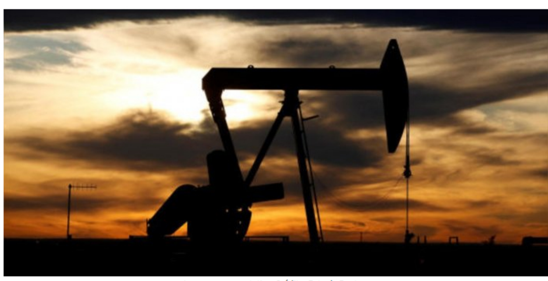
Imagen representativa.

Reuters, Bogotá, 15 DE SEPTIEMBRE DE 2020, 08:07 IST | ACTUALIZADO: 15 DE SEPTIEMBRE DE 2020, 08:07 IST