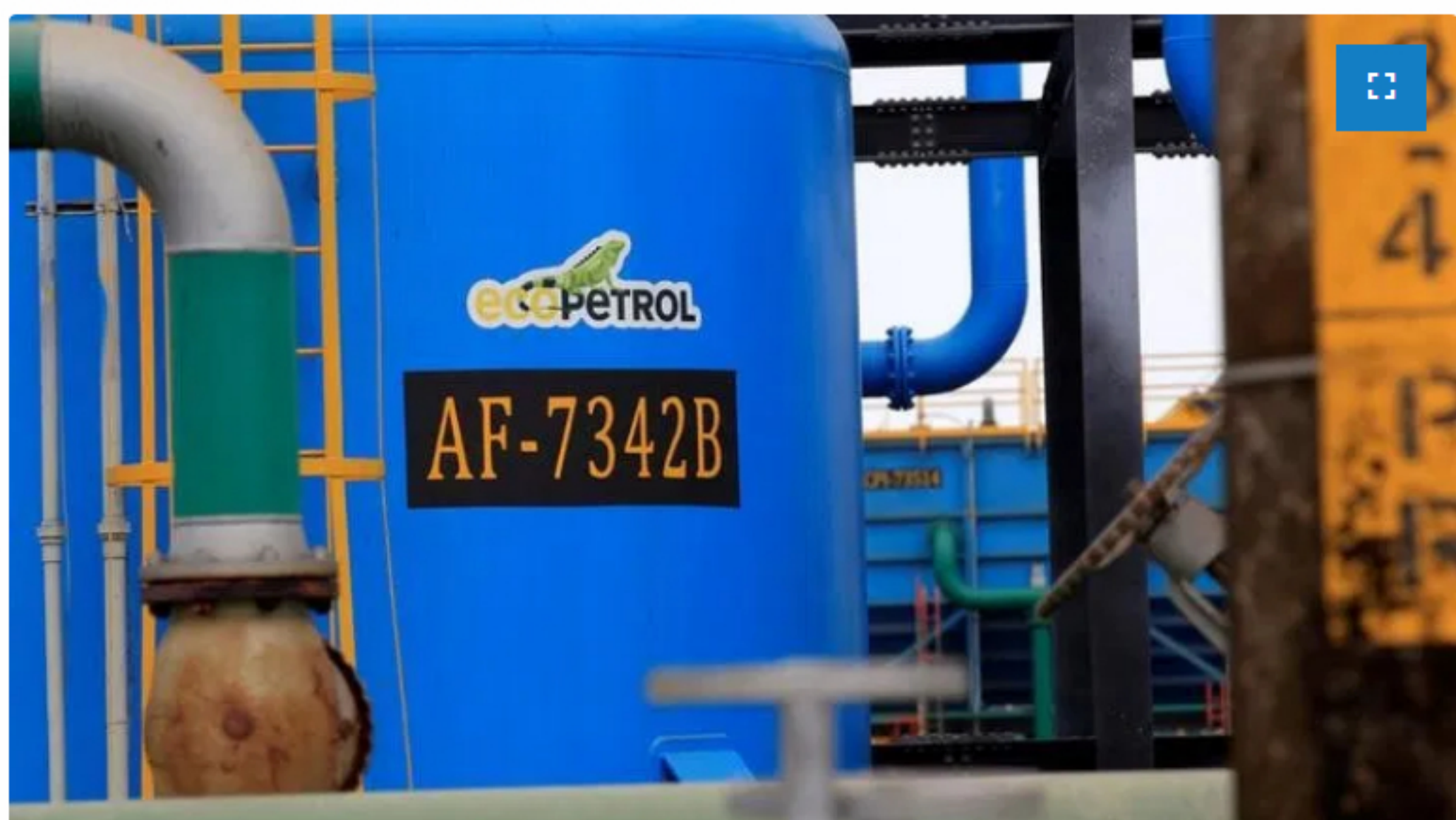
LYNXMPEG8D1XS.jpg,Foto de archivo. Un tanque de almacenamiento de petróleo de Ecopetrol, en Castilla La Nueva, Colombia. 26 de junio de 2018. REUTERS/Luisa Gonzalez.; Crédito: Luisa Gonzalez, Reuters