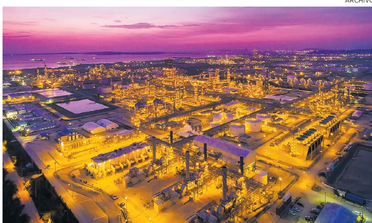
Aspecto de la instalaciones de la Refinería de Cartagena (Reficar).

Consultados por EL HERALDO los líderes de seis de las empresas más grandes de la Costa Caribe exponen su visión sobre la recuperación de las actividades económicas.